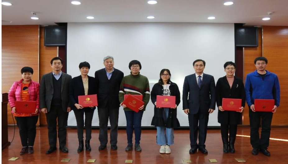
会议对优秀职工进行了表彰