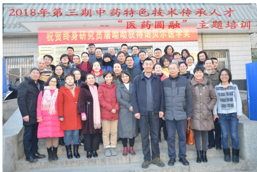
第三期中药资源普查药用植物专题培训班全体合影

为发展能医擅药双料人才培养，贯彻落实推进中医药人才的传承，切实做好全国中药特色技术传承人才培养项目，培育基地于2018年12月19日-12月21日举办了全国中药特色技术传承人才培养项目中药特色技术传承人才--“医药圆融”的主题培训班。本次培训学员共有40余人，不仅包括项目内的传承人才，还有来自全国各地的中医临床、药剂科的医师和在职人员。