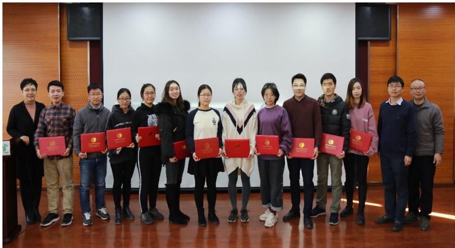
会议对优秀学生代表进行了表彰