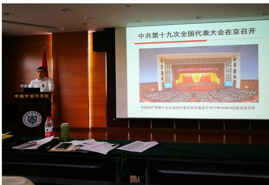
黄璐琦院士做十九大专题报告

会上，黄璐琦院士就十九大主题、我国发展新的历史方位及主要矛盾等党的精神进行了传达，并结合实验室方向及人才队伍特点，着重讲解了十九大报告中关于国家青年人才创新发展战略，号召全体职工认真学习领会、贯彻落实党的十九大对青年人才寄予的期望，不忘初心，牢记使命，坚定理想信念，敢于创新实践，脚踏实地的传承发展中医药事业，勇做时代的弄潮儿。