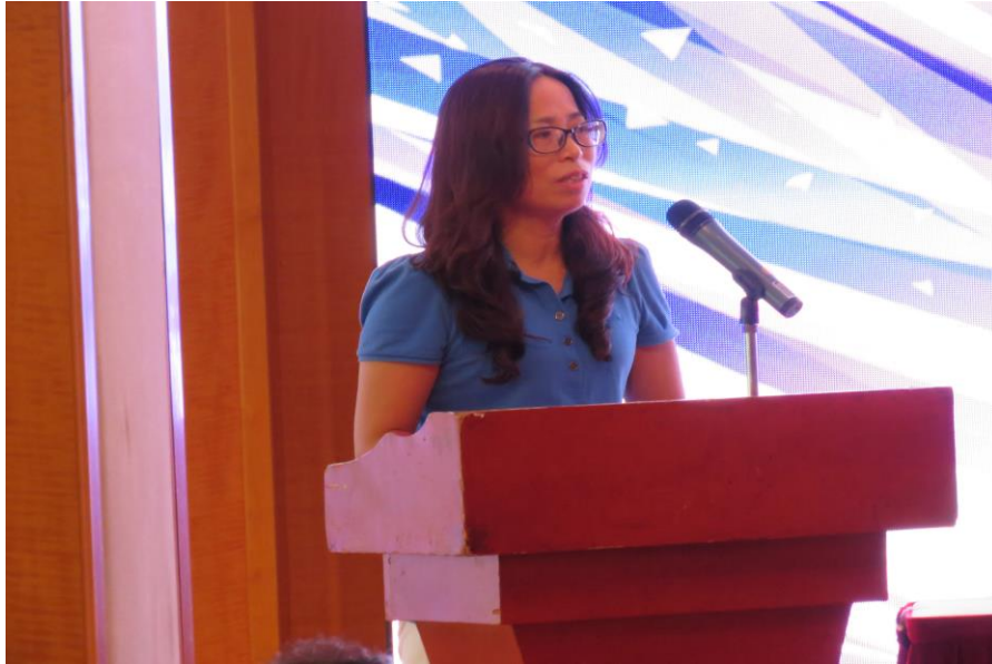
孙丽英副巡视员致辞

次会议的召开势在必行。孙丽英副巡视员则对《中医药法》进行了全面的阐释，她表示，《中医药法》的颁布对中医药事业发展具有里程碑的重要意义，它从法律层面明确了中医药的重要地位、发展方针和扶持措施，为中医药事业发展提供了法律保障。