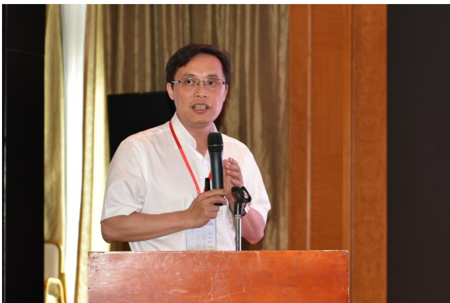
黄璐琦院士致开幕词

为落实《中医药法》，大力推进中药生态农业发展，7月4日，由培育基地与中国中药协会中药资源多样性与生态经济专业委员会（TEEB）联合主办，中山市中智药业集团有限公司承办的2017年中国中药协会“中药资源多样性与生态经济专业委员会（TEEB）”学术交流研讨会在广东省中山市隆重召开。原国家中医药管理局副局长、中国中药协会会长房书亭、原国家中医药管理局副局长李大宁、云南农业大学名誉校长朱有勇院士、培育基地主任黄璐琦院士、国家中医药管理局科技司副巡视员孙丽英以及来自各省（区、市）特约专家和代表150余人出席本次会议。会议由中国中医科学院中药资源中心副主任郭兰萍研究员主持。