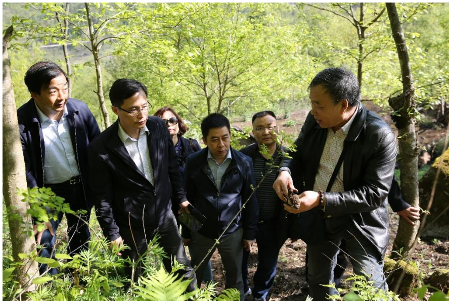
实地调研中药材种植基地

在宁陕县，黄璐琦院士细心听取了宁陕县中药材产业的基本情况和目前面临的主要困境，并前往四亩地镇实地调研了猪苓、天麻、丹参、五味子、重楼和林麝等中药材种植、养殖业现状。在调研期间，着重询问了猪苓种植户、四亩地镇政府和猪苓专家关于猪苓生长环境、种质资源、种植技术、销售渠道和投入收益等关键问题，协调培育基地、宁陕县政府和梦阳药业三方筹建猪苓种源基地，拟投入我方科研力量，助力推进猪苓药材饮片及制剂品种的产业研究与转化。