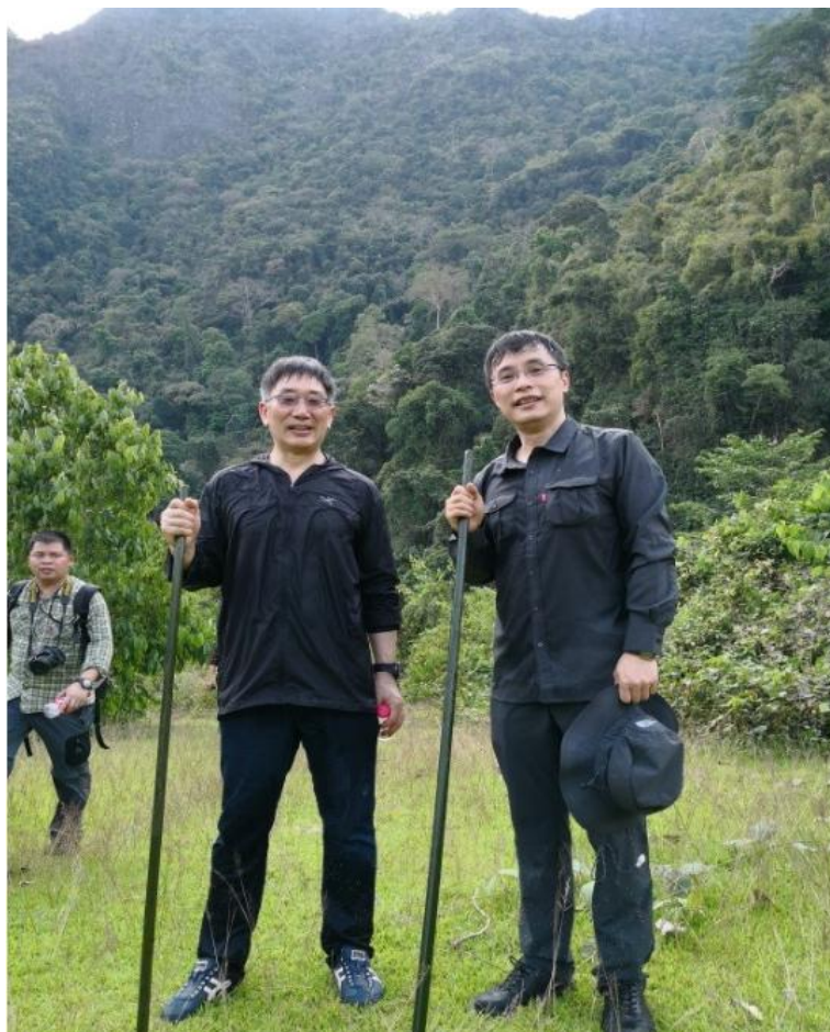
开展老挝药用植物考察

比较研究，培养老挝药用植物资源研究人才，有效提升老挝在药用植物资源开发与应用技术水平。