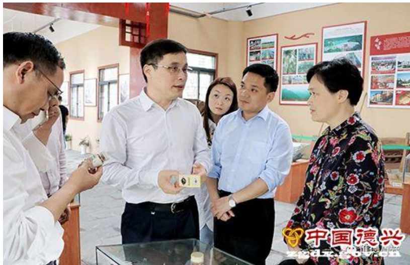
黄璐琦院士听取有关人员介绍德兴市中草药种植情况

黄璐琦主任一行来到天海药业认真查阅有关资料，听取了有关负责人的情况介绍，详细了解德兴市在中草药种植和生产研发等方面的相关内容。黄璐琦主任表示希望德兴市继续高度重视中医药产业发展，不断完善工作机制，加大资金扶持力度，培养中药材产业人才，大力引进有实力的中医药龙头企业，不断增加产品附加值，推进德兴大健康产业科学、健康、持续发展。