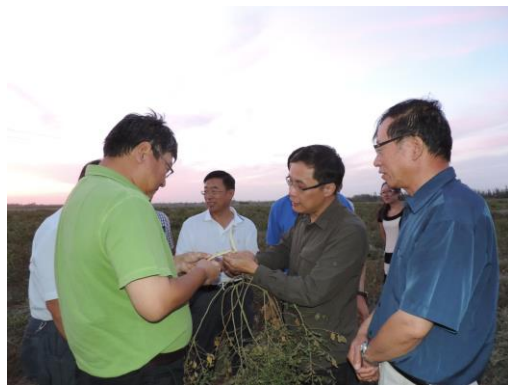
查看甘草基地药材质量