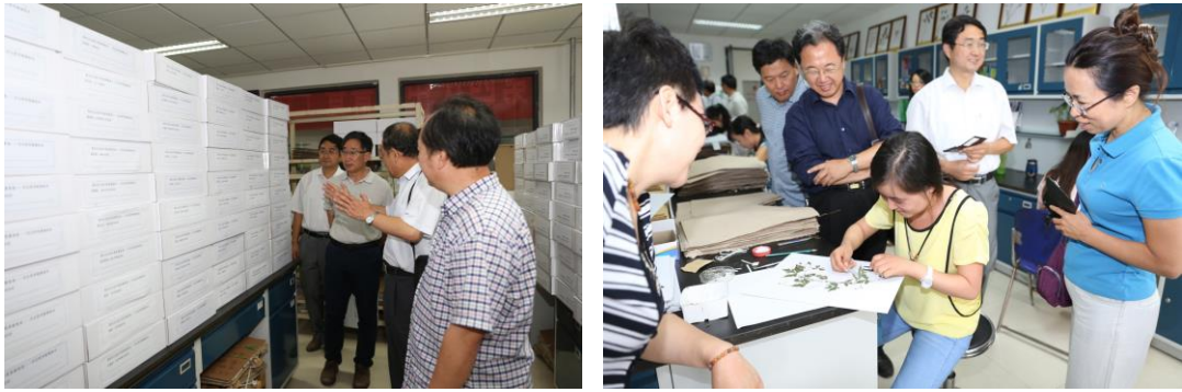
实物标本制作等内业整理工作