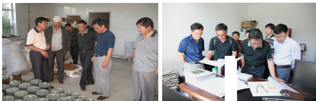
督导组考察呼伦贝尔市蒙医医院标本制作中心