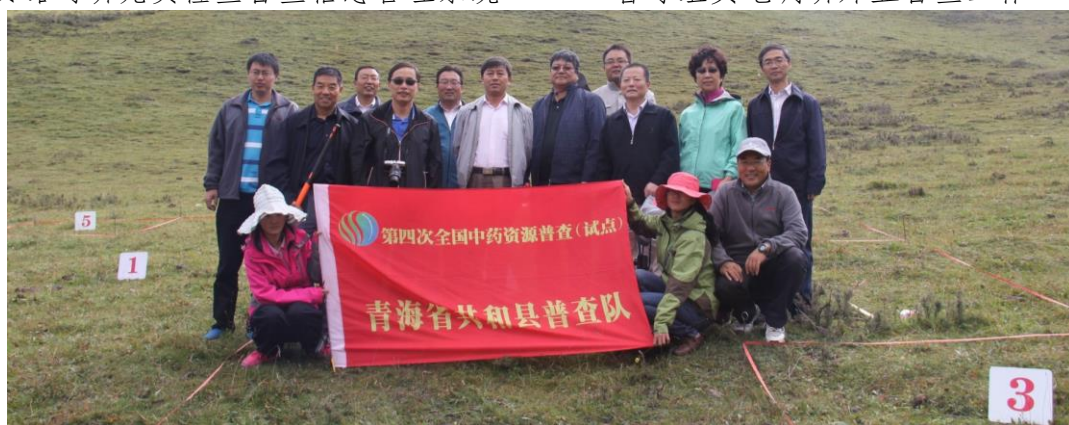
督导组与普查队员合影