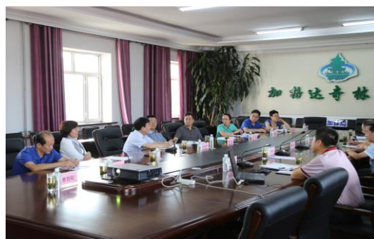
听取普查试点工作汇报