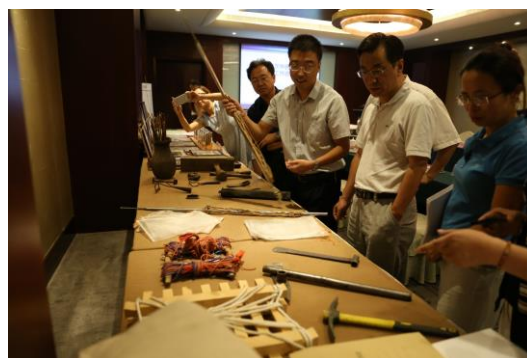
督导组参观普查成果展示