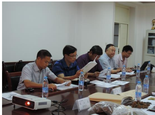
听取甘肃省中药资源普查试点工作汇报