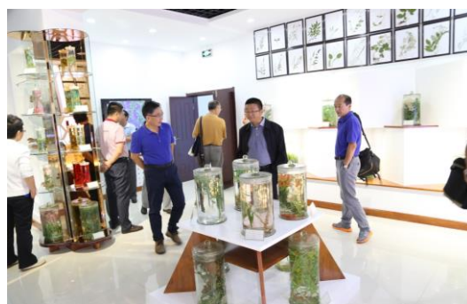
参观普查试点工作成果展示