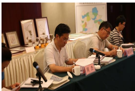
国家中医药管理局科技司副司长周杰讲话

通过会议交流和现场检查，督导组专家充分肯定了河北省中药资源普查试点工作所取得的成绩，指出我省中药资源普查组织结构科学合理、普查数据详实、完成质量较高，并指出了一些改进性的建议。周杰副司长充分肯定了河北省中药资源普查试点工作所取得的成绩和付出的努力，同时提出三点要求：一是抓住京津冀发展的战略机遇，继续加强组织领导，进一步提高对普查试点工作重要意义的认识；二是认真总结试点工作所取得的经验，找出存在的问题，为下一步普查工作全面铺开打好基础；三是要认真做好普查试点收尾工作，做好普查验收准备。韩同彪副局长表示，河北省中医药管理局会进一步加强普查的指导、协调、监督及评估工作，积极筹措配套基金，保证普查试点工作的质量。