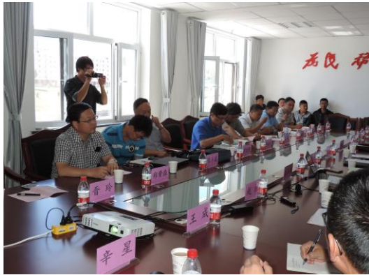
听取肃南县中药资源普查试点工作汇报