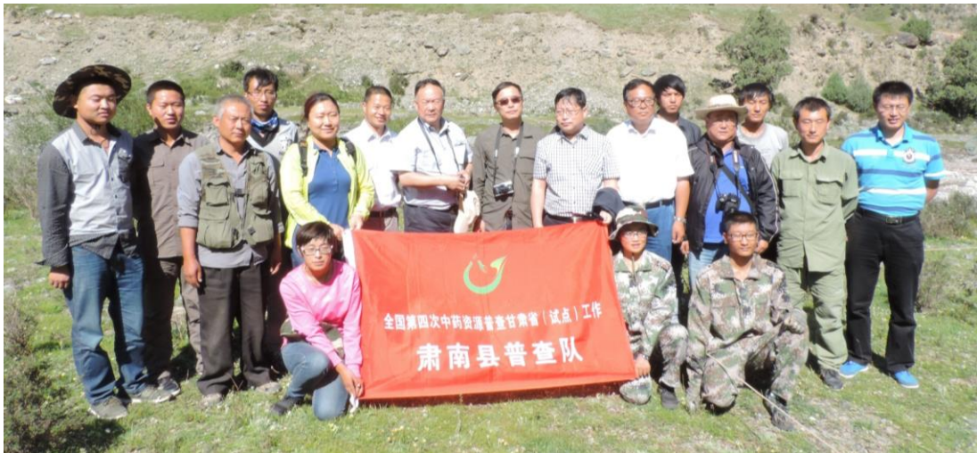
督导组专家与野外普查队员合影