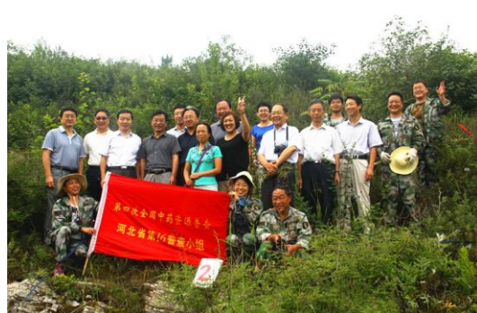
督导组与普查队员合影