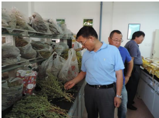
检查肃南队内业整理工作