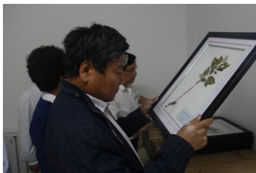
武东副司长查阅标本