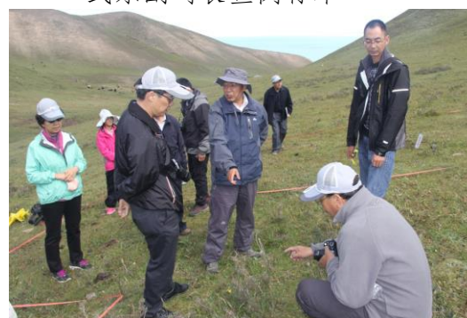
督导组实地调研外业普查工作